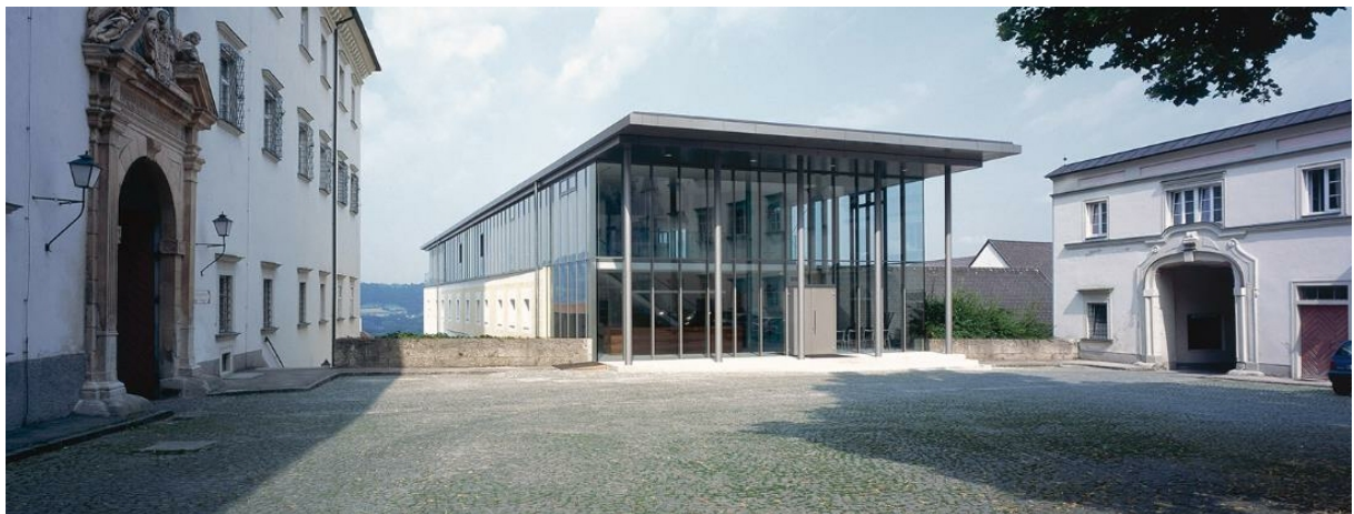
Genusszentrum Stift Schlierbach, Planung Luger & Maul Architekten, Baujahr 2005